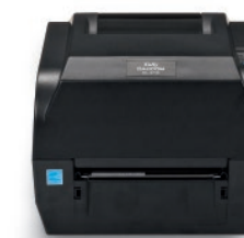
DL-210 / DL-310